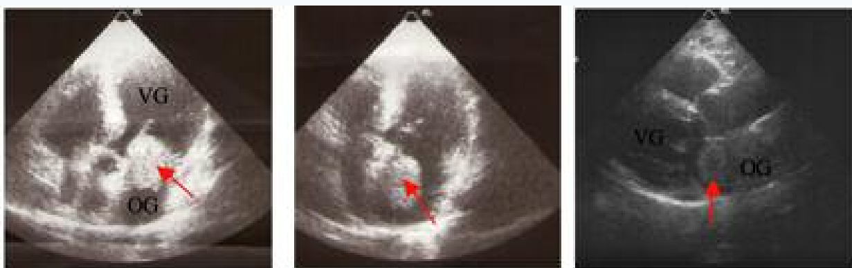
Figure 1 : Aspect à l'échographie trans-thoracique du myxome (flèche).

La résection du myxome avec double pontage aorto-coronaire en urgence a été effectuée dans les 48 heures