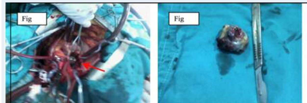
Figure 3 : Aspect per-opératoire du myxome (3A) et de la pièce de résection (3B)

Les auteurs déclarent de ne pas avoir de conflits d'intérêts